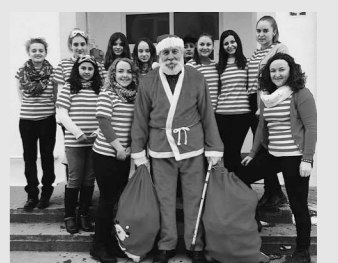
Kicsiknél-nagyoknál járt a Mikulás