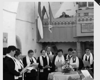
Hűsz éves a szentmártoni nőszövetség