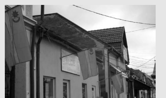
Zászlókkal tiltakoztak Szeredában a székely zászló meghurcoltatása ellen