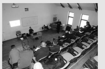
Magyarországiak képezték a tűzoltóinkat