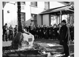
Idén is emlékeztek Nagy Ferencre